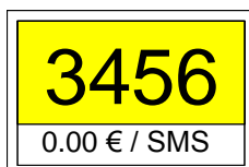
Illustration 4 : Couleurs possibles